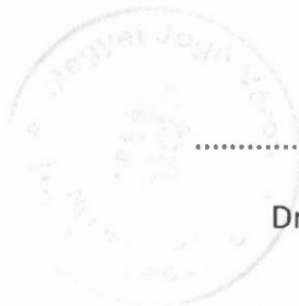
Dr. Kovács Ferenc polgármester